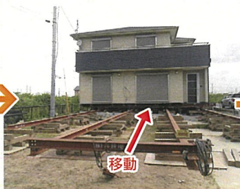
曳家工法で住宅ごと横に移動