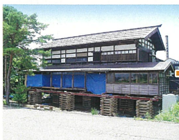
新設基礎工事のため 2m 高上げ