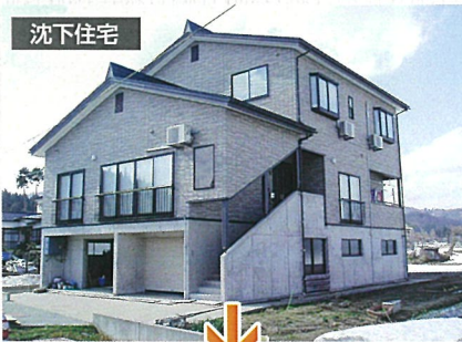
鋼管圧入・ジャッキアップ