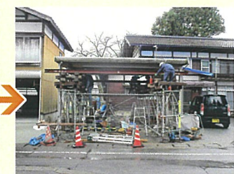
沈下したカーポートのジャッキアップ工事