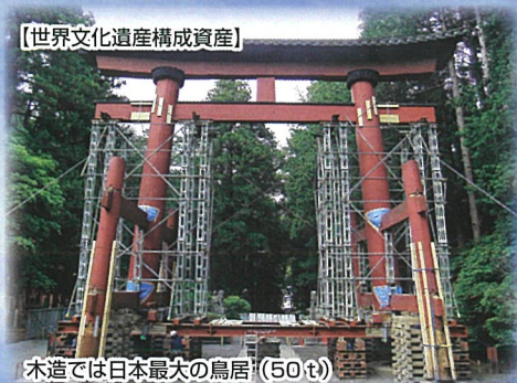
木造では日本最大の鳥居(50㍓)