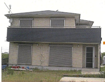
沈下住宅 (30cm 沈下)