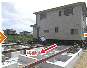
新設した基礎に曳戻し