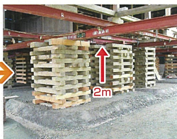
住宅下で新設基礎工事が可能