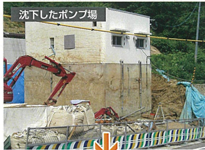
H型鋼耐圧版・ジャッキアップ